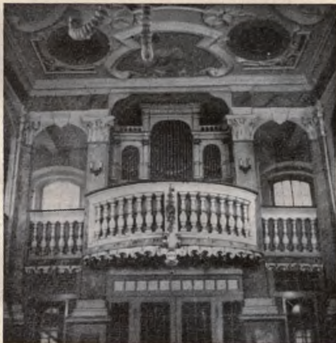
Pišćele w Delnim Wujedze