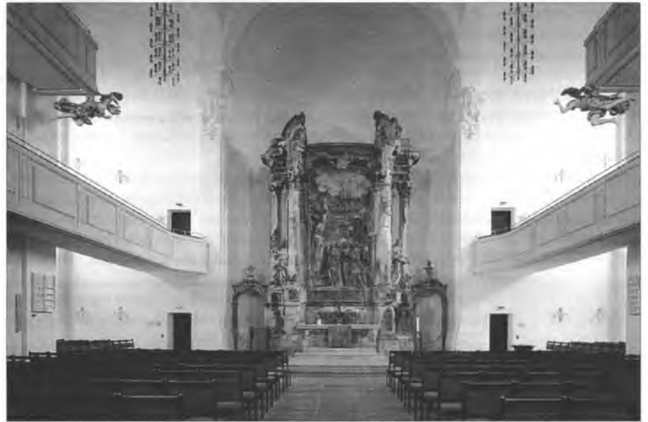
Cyrkej Třoch kralow w Drježdžanach – schadźowanišćo sakskeje synody

Cyrkwyje su romy modlenja. To smy zaso dožiwili w dnjach po grawoćiwym 11. sep-