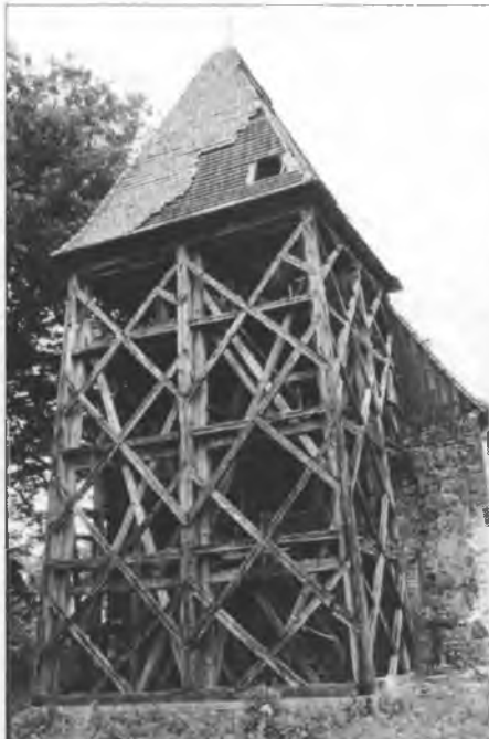
Zwonica z lěta 1418 bu 1990 w Klěšniku wottwarjena (lěwy wobraz) a 1994 w Pricynje znawa natwarjena (prawy wobraz).