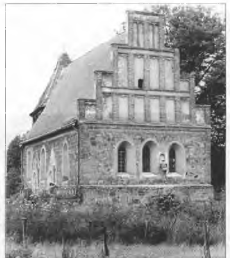
Cyrkej w Klěšniku, 1990/91 spóžrěta wot wuhloweje jamy Wjelcej

Stary kěrchow wosrjedź wsy spóznaješ džensa na starych štomach a zbytkach kěrchowsekeje murje. Někotre rowy tam hišće namakaš. Wobrys něhdyšeje cyrkweje je z kamjenjemi wukładženy. Móćna zwonica z drjewa městno wobkneži. Zwonica pochadža z Klěšnika (Wolkenberg), kotryž bě 1990/91 spóžrěta wuhlowa jama Wjelcej