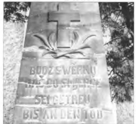
Pomnik za padnjonych 1. swětoweje wójny w Hućinje

Ze swojich poslednich šulskich lět wěm so dopomnic, zo wotmě so při tajkim pomniku w susodnej wsy kóžde nalěto zjawnja swjatočnosć. Narěć knjeza wučerja bě wot spěwow šulerjow a wjesneho muskeho chóra wobrubjena. Při zynkach spěwa wo dobrym towaršu (kameradu) kładžechu so seklate wěncy. Při přečitanju mjenow padnjonych zahudži trochu w pozadku